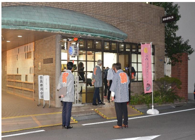
昭和薬貿ビル入口の様子