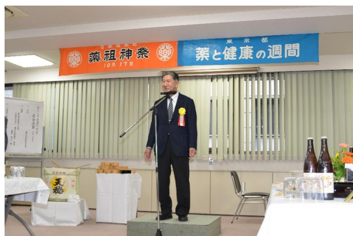
日製薬団体連合会宮島理事長のご挨拶