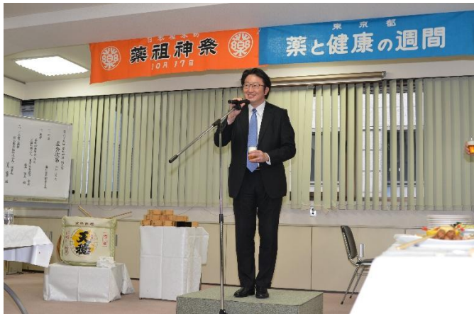
福神 副会長による乾杯のご発声