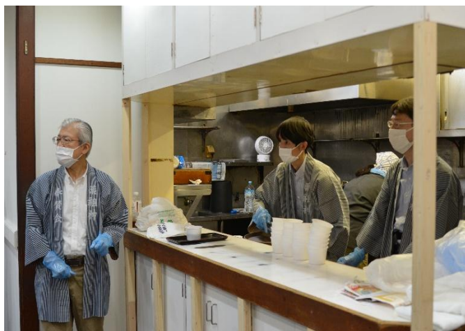
お汁粉会場の様子