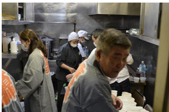
お汁粉スタッフの皆さま