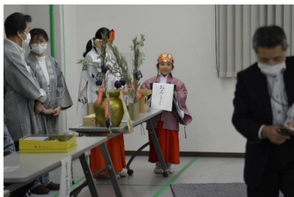
おみくじコーナー