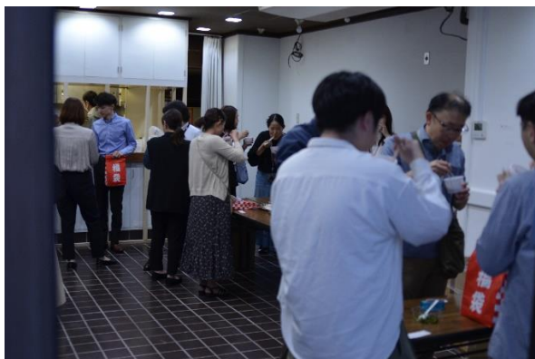
お汁粉会場の様子