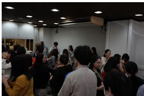
お汁粉会場の様子