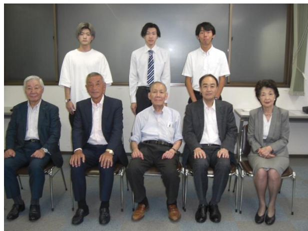
奨学生選考委員の理事の方との記念撮影