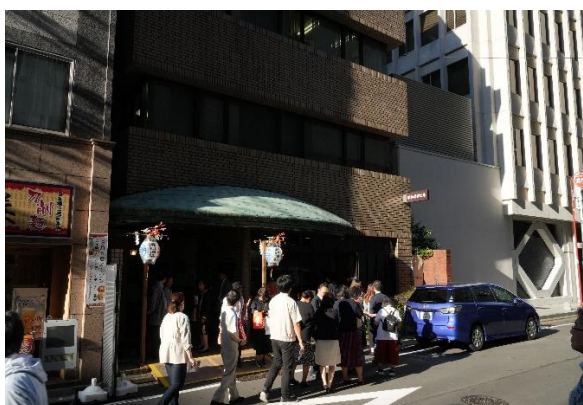
昭和薬貿ビル入口の様子