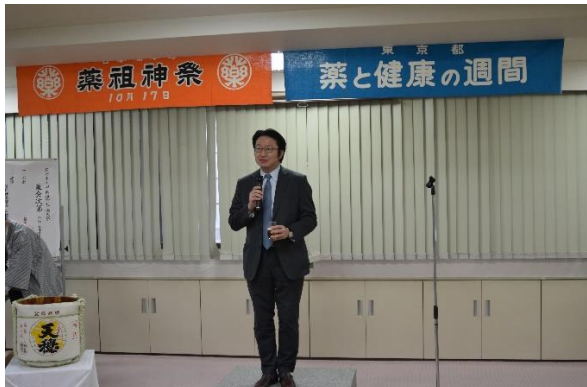
福神 副会長による乾杯のご発声