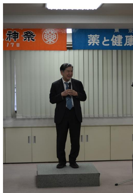
日本製薬団体連合会宮島理事長のご挨拶